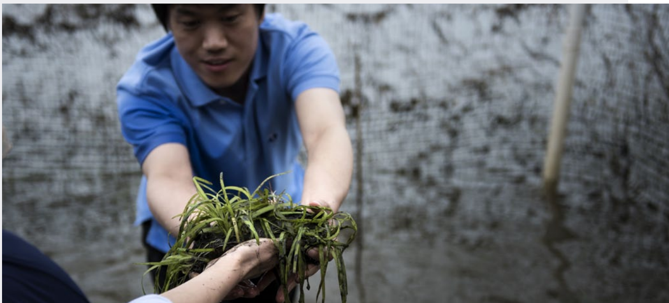
種植海草有助於降低大氣中的碳濃度。

儘管富達希望透過投資和參與盡可能地實現減排，並於 2050 年讓全數投資組合淨排放量均為零，但同時也將主動漸進地調降對動力煤的曝險，預計在 OECD 市場的達標時間為 2030 年，在全球則為 2040 年。逐步撤資將在一段時間內進行，讓公司有機會減碳，並證明確實有心追求淨零排放。富達永續基金系列亦適用其他排除規定。