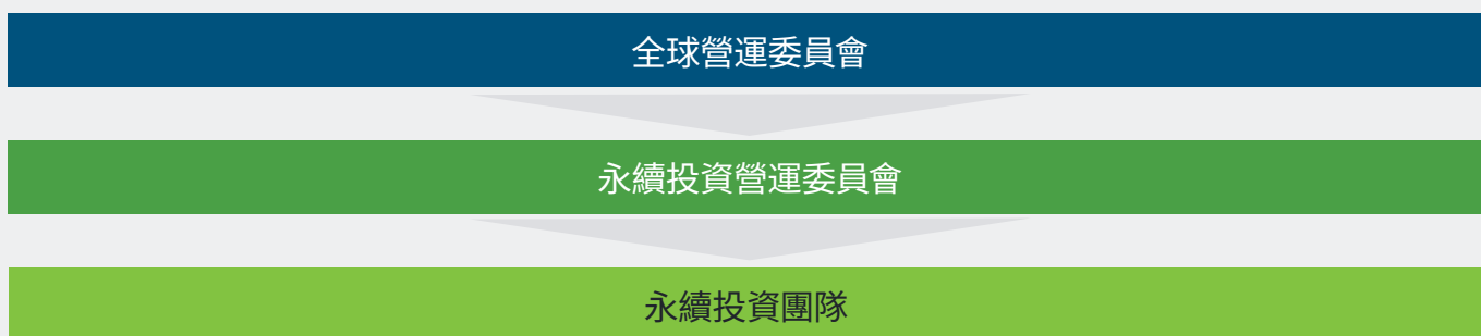
圖1: 永續投資營運委員會

如果富達將某些資產的投資管理責任委託給第三方，則該等資產並不適用於本政策，而在適當情況下，我們傾向以負責管理這些資產的實體所訂股東參與政策為依據。我們對我們委託機構的政策進行初步審查，包括與參與政策有關的規定，並在與該機構進行盡職調查時監督這些政策的實施狀況。