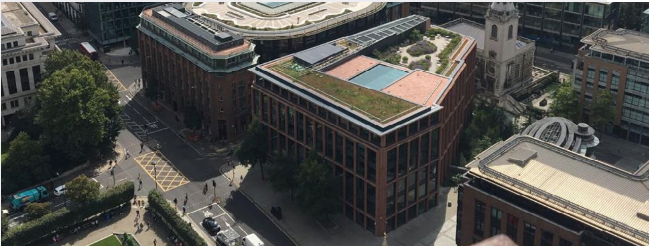
富達國際在Cannon Street的辦公室。

聯繫我們時，請注意 FIL Limited (富達國際)、我們的組織及其子公司和附屬公司是獨立於 Fidelity Investments / Fidelity Management and Research Company (FMR) 和 Fidelity Institutional Asset Management (FIAM) 的獨立公司，統稱為富達資產管理 (FAM)，其他具有相似名稱的組織亦然。我們設有嚴格的資訊屏障，以確保敏感的投資和投票數據不得於 FIL Limited 和 FAM 的投資專業人士之間共享交流。