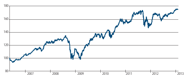
法巴 L1 新興市場當地貨幣債券基金自原成立日以來淨值走勢