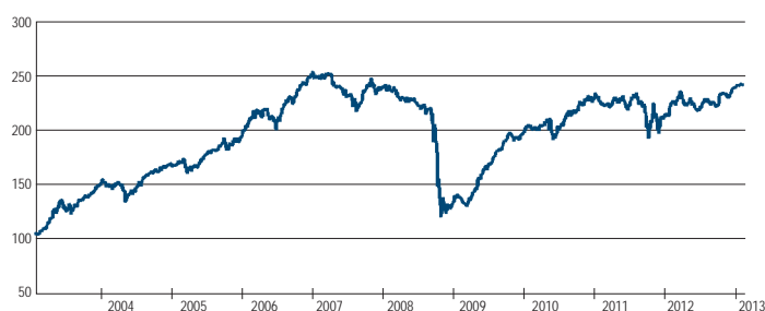
法巴 L1 全球新興市場精選債券基金過去十年淨值走勢