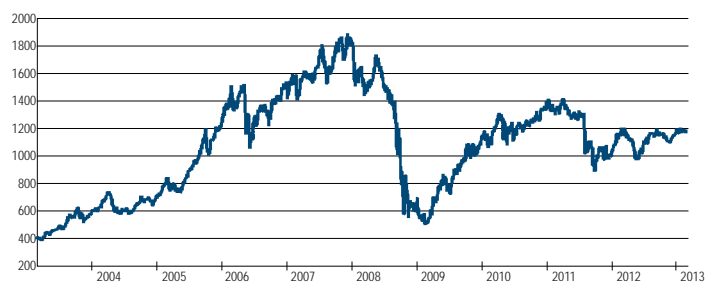
法巴 L1 新興歐洲股票基金過去十年淨值走勢