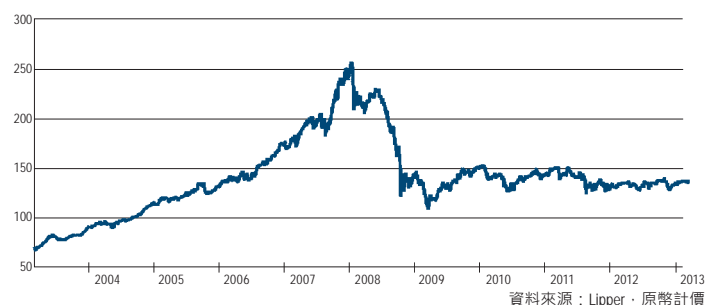
法巴 L1 全球公用事業股票基金過去十年淨值走勢