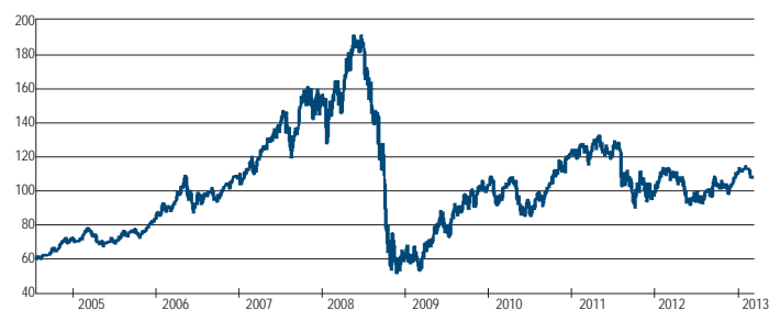
法巴 L1 全球原物料股票基金自原成立日以來淨值走勢