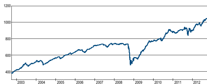
法巴 L1 新興市場債券基金過去十年淨值走勢