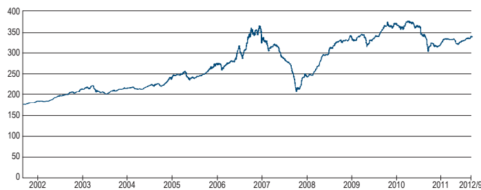
百利達亞洲可換股債券基金過去十年淨值走勢