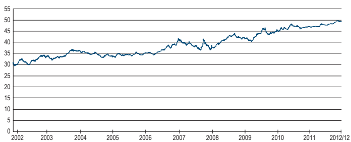
百利達全球靈活債券基金過去十年淨值走勢