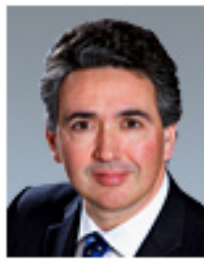
多明尼克·羅西 (Dominic Rossi) 富達全球股市投資長

在上週五(6/1)美國失業數據遠低於市場預期，引發美股重跌後，週一(6/4)亞股幾乎全軍覆沒(印股除外)，包括中港台日與南韓紛紛重跌，其中日本股市更是跌至近30年來低點。